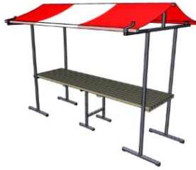
3 meter Marktkraam STANDAARD